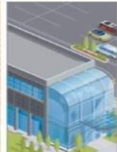
Prise de possession et exploitation